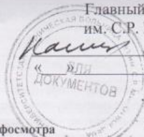
ГРАФИК проведения периодического профосмотра сотрудников Университетской клинической больницы №1 им. С.Р. Миротворцева на 2024 год.