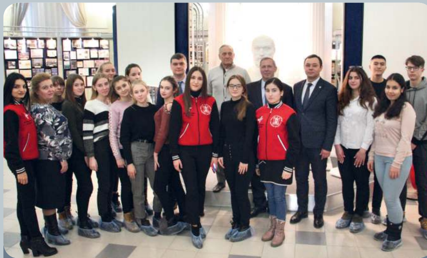
Саратовский медицинский университет расширяет формат проведения профориентационной работы.