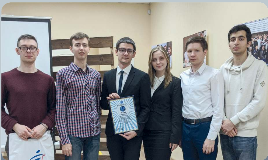
Студенты СГМУ стали победителями региональных игр «Что? Где? Когда?» и вышли в финал окружного конкурса.