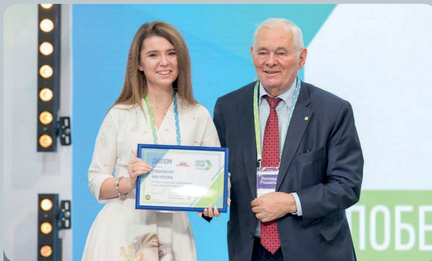
Доцент СГМУ вошла в число победителей конкурса «Лидеры России» по специализации «Здравоохранение».

«Лидеры России» – флагманский проект президентской платформы «Россия – страна возможностей». Специализация «Здравоохранение» стала одним из трех профильных треков проекта, задачей которого является выявление наиболее перспективных кадров в рядах системы здравоохранения России и формирование состава государственного кадрового резерва для разных уровней должностей.