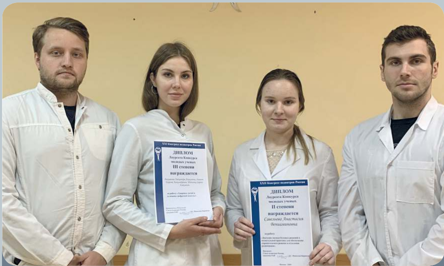
Научные работы студентов СГМУ отмечены в числе лучших на XXII Конгрессе педиатров России «Актуальные проблемы педиатрии».