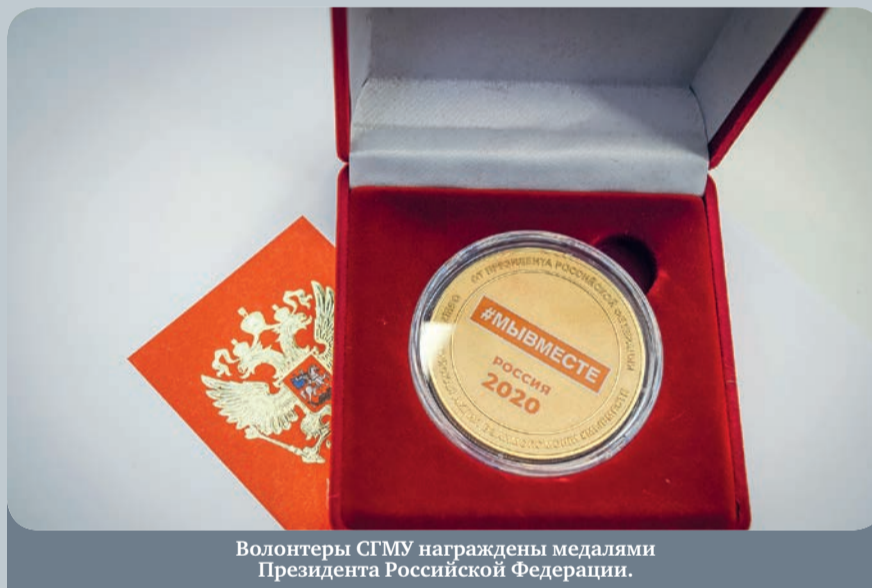
Волонтеры СГМУ награждены медалями Президента Российской Федерации.