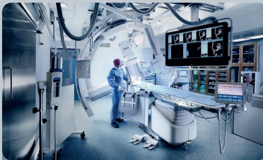
СГМУ приступает к реализации инновационного образовательного проекта «Врач будущего».