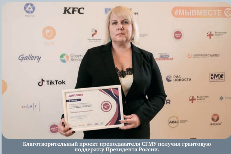
Благотворительный проект преподавателя СГМУ получил грантовую поддержку Президента России.